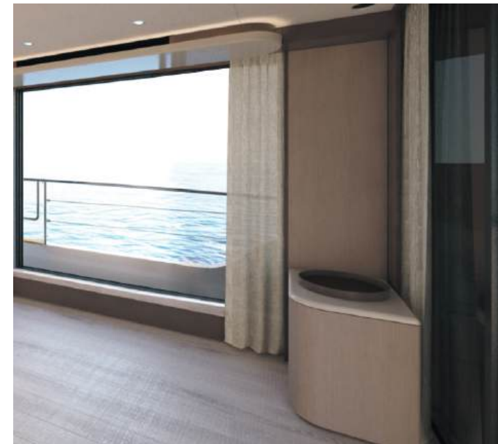
Low cabinet | Mobile basso