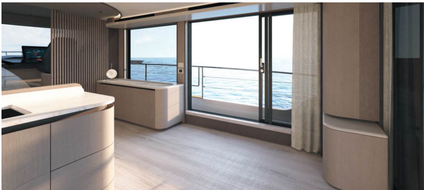
Glassware cabinet | Mobile cristalleria