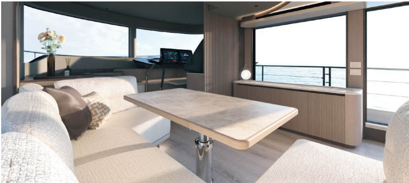
Folding and drop-down dining table | Tavolo da pranzo ripieghevole e abbattibile