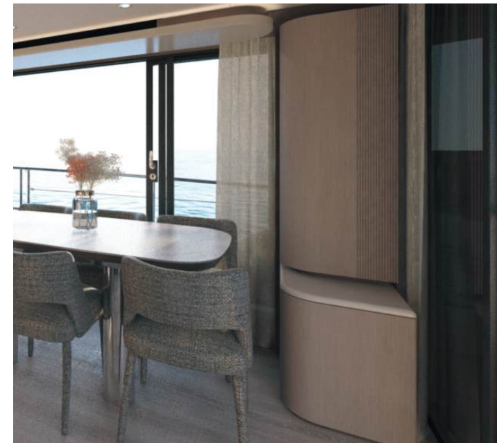
Glassware cabinet | Mobile cristalleria