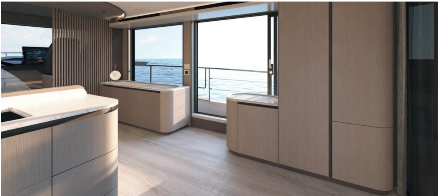
Glassware and storage units | Ampio mobile stivaggio e cristalleria