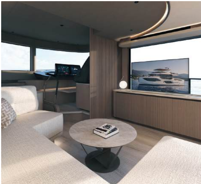
Coffee table | Tavolino da caffè