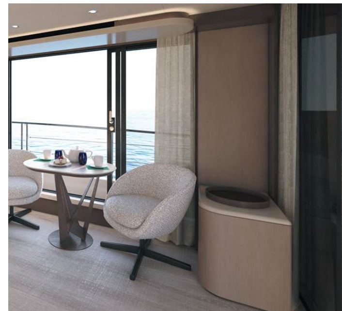
Low cabinet | Mobile basso