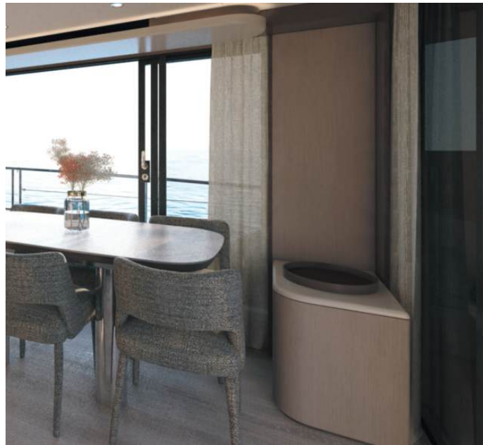
Low cabinet | Mobile basso