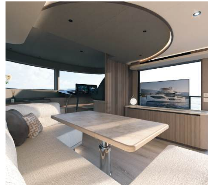
Folding and drop-down dining table | Tavolo da pranzo ripieghevole e abbattibile