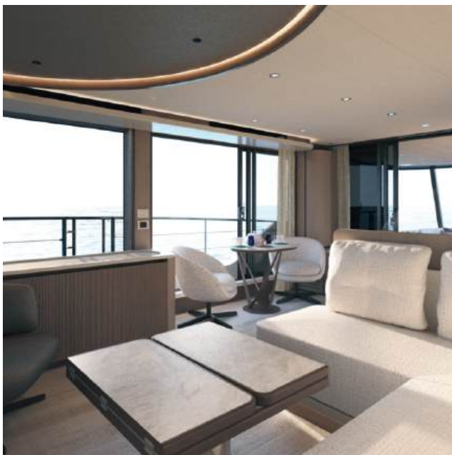
Folding and drop-down dining table | Tavolo da pranzo ripieghevole e abbattibile