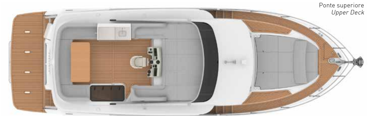
Ponte superiore Upper Deck