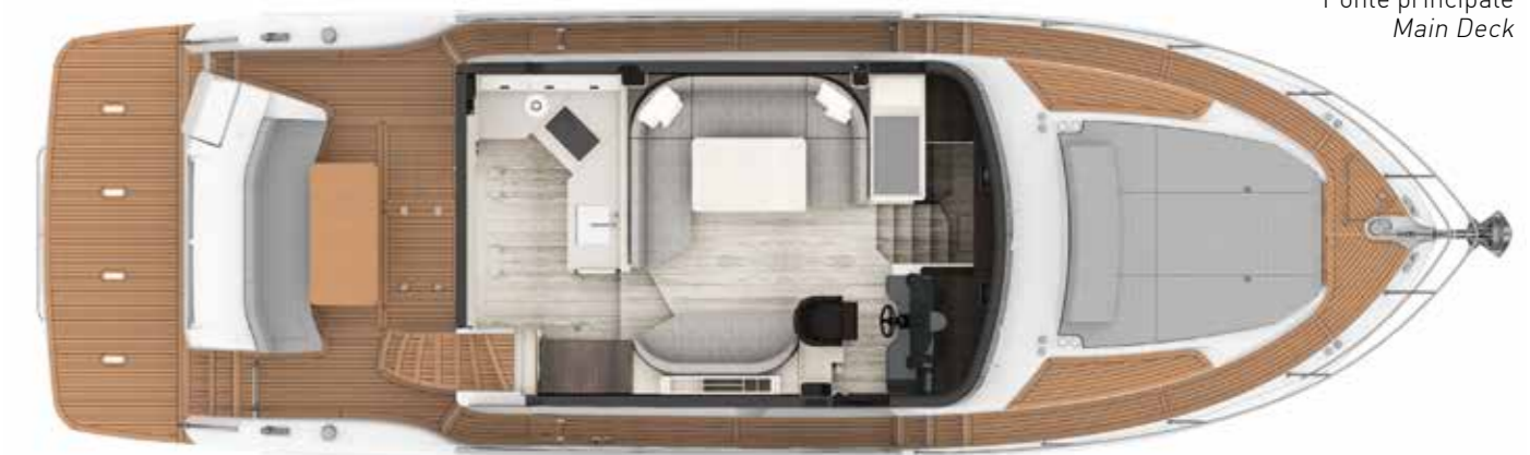
Ponte principale Main Deck