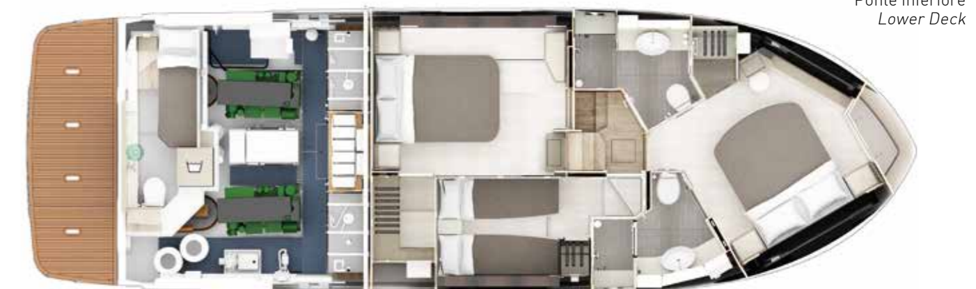
Ponte inferiore Lower Deck